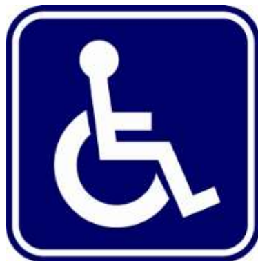
สัญลักษณ์ผู้พิการ